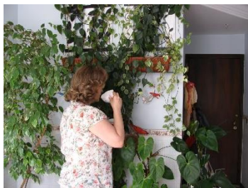
Camicetta a fiori

Per indicare il motivo del tessuto usiamo la preposizione A .