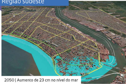
2050 | Aumento de 23 cm no nível do mar