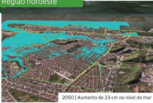
2050 | Aumento de 23 cm no nível do mar