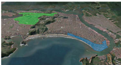
As zonas noroeste (em verde) e sudeste (azul) de Santos serão as mais afetadas pela elevação do nível do mar, segundo pesquisa publicada em 2018 – Fotos: Reprodução Google Earth / Projeto MetrÓpole via revista Pesquisa Fapesp