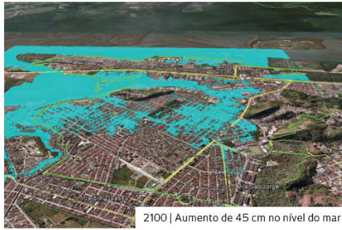
2100 | Aumento de 45 cm no nível do mar