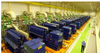
Usina termoeletrica em Camaçari, Bahia

fazer diagnósticos e previsões sobre o comportamento do clima e outras variáveis. Costa também enfatizou a necessidade da busca de soluções. “A gente já sabe que o cenário é catastrófico”, disse. O desafio maior