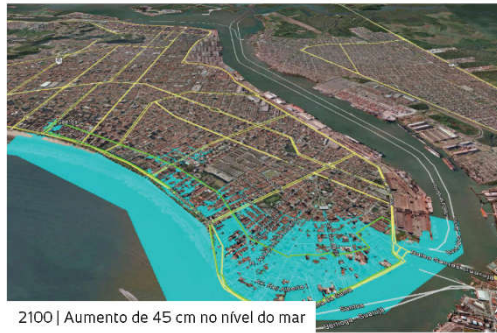
2100 | Aumento de 45 cm no nível do mar

Simulações de inundação por elevação do nível do mar em Santos – Fotos: Reprodução Google Earth / Projeto Metrôpole via revista Pesquisa Fapesp