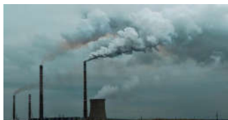
Gases de combustão lançados por chaminés

O físico José Goldemberg destacou a necessidade de zelar pela sustentabilidade da matriz energética brasileira, que teve sua reputação parcialmente manchada nos últimos anos pela “má gestão dos reservatórios” das hidrelétricas — forçando, por consequência, o acionamento de usinas termelétricas, movidas a combustíveis fósseis, com alta emissão de carbono. Algumas hidrelétricas recentes foram feitas de forma “desastrosa”, segundo ele, incluindo a de Belo Monte, na Amazônia. Para Goldemberg, o aumento da população e da demanda por energia elétrica representa uma encruzilhada para o País: ou melhora-se o planejamento e o gerenciamento das hidrelétricas (energia limpa), ou aumenta-se o