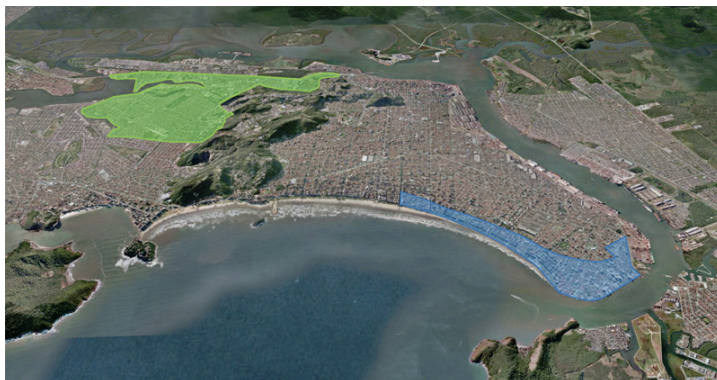
Acima, as zonas noroeste (em verde) e sudeste (azul) de Santos serão as mais afetadas pela elevação do nível do mar, segundo pesquisa publicada em 2018 – Fotos: Reprodução Google Earth / Projeto Metr pole via revista Pesquisa Fapesp

mais quando vão para a UTI do que para a igreja”, disse. “Temos que fazer a mensagem chegar no cidadão, se não vamos continuar sempre pregando para convertidos.”