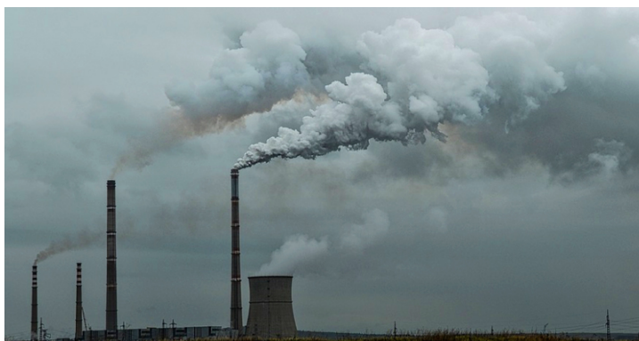
Gases de combustão lançados por chaminés

O físico José Goldemberg destacou a necessidade de zelar pela sustentabilidade da matriz energética brasileira, que teve sua reputação parcialmente manchada nos últimos anos pela “má gestão dos reservatórios” das hidrelétricas — forçando, por consequência, o acionamento de usinas termelétricas, movidas a combustíveis fósseis, com alta emissão de carbono. Algumas hidrelétricas recentes foram feitas de forma “desastrosa”, segundo ele, incluindo a de Belo Monte, na Amazônia. Para Goldemberg, o aumento da população e da demanda por energia elétrica representa uma encruzilhada para o País: ou melhora-se o planejamento e o gerenciamento das hidrelétricas (energia limpa), ou aumenta-se o uso de termelétricas (energia suja). “É um problema científico”, disse.