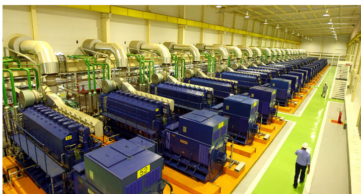
Usina termelétrica em Camaçari, Bahia

Ao final das apresentações, os cientistas se reuniram em cinco grandes grupos temáticos para a produção de relatórios, com recomendações, que serão discutidas numa série de workshops ao longo dos próximos dois meses, para a concepção do novo “plano científico” do programa.