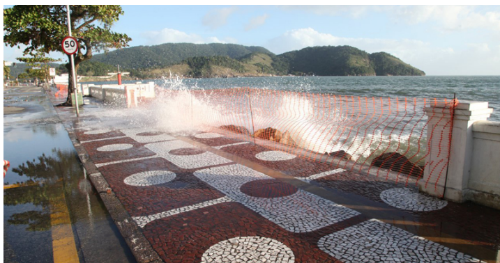
Elevação do nível do mar é uma ameaça para Santos e outras cidades costeiras do litoral paulista

O recado da ciência é claro e já vem sendo dado há algum tempo: o aquecimento global é um problema real, causado pelo homem, com consequências climáticas gravíssimas, e que precisa ser atacado com urgência por todos os países, pelo bem da humanidade.