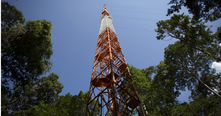
Torre Atto ajuda nos estudos sobre mudanças climáticas na Amazônia. Vários estudos feitos na torre são financiados pela Fapesp