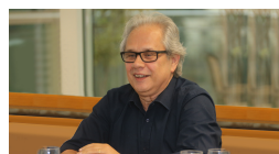
O que o Brasil ganha com as mudanças climáticas

produção científica paulista sobre o tema, de aproximadamente 15 artigos publicados por ano em 2007 para 280 artigos, em 2018 (Figuras 1 e 2); grande parte deles feita em parceria com pesquisadores de outros Estados e países.