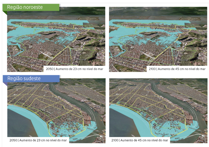
Simula es de inunda o por eleva o do n vel do mar em Santos – Fotos: Reprodu o Google Earth / Projeto Metr pole via revista Pesquisa Fapesp

“Precisamos de excel ncia na ci ncia e tamb m na comunica o com a sociedade, que sofre os impactos desse fen meno”, disse Brito Cruz, segundo a Ag ncia Fapesp . “N o   quest o de opini o,   uma quest o comprovada por pesquisa, medi o, teste e verifica o h  muitos anos por cientistas em todo o mundo. O que eu percebo   que n s, brasileiros, mas tamb m cientistas americanos, franceses e ingleses, n o estamos conquistando os cora es e mentes.”